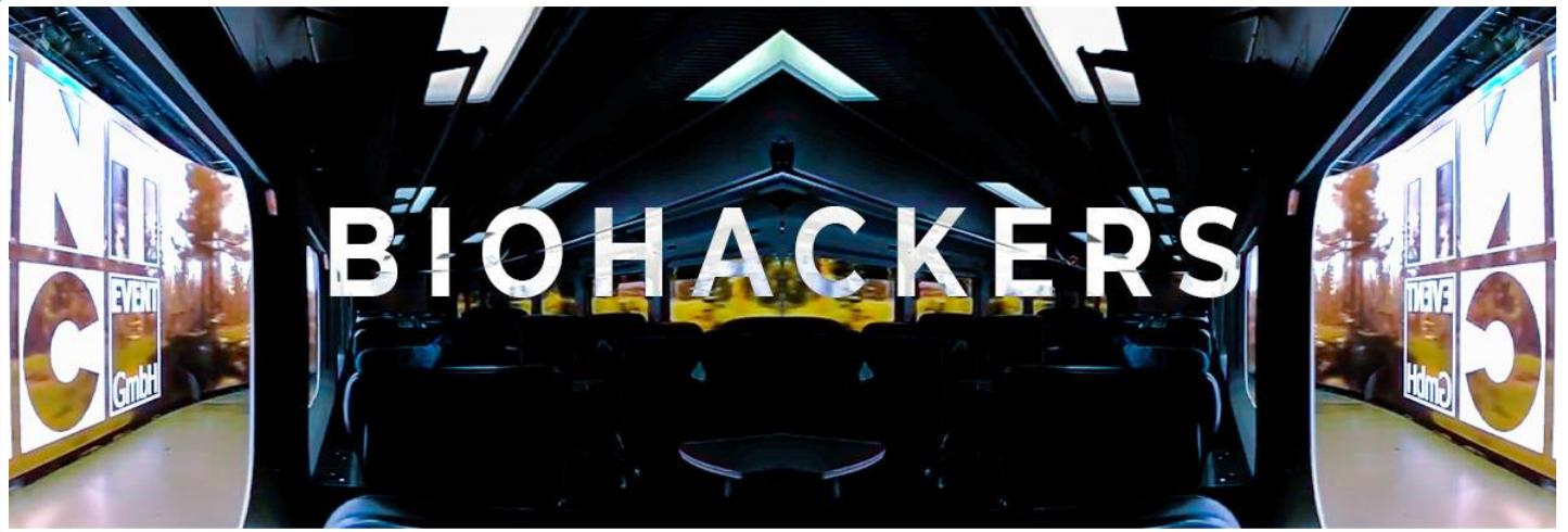
Les media serveurs Picturall Pro pilotent les murs d'images LED pour la série télévisée "BioHackers" (Rent Event Tec - Allemagne)