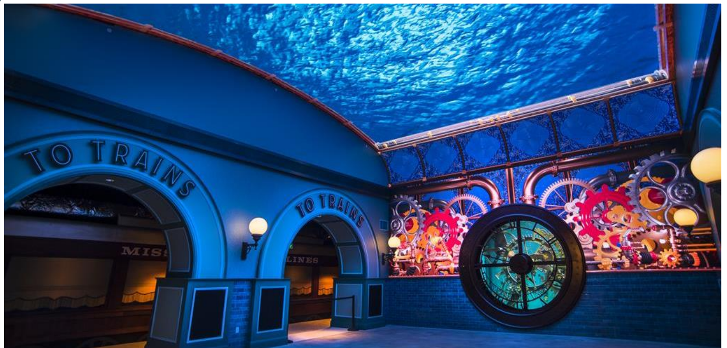
Un média serveur Picturall Pro pilote les murs d'images LED de l'entrée du nouvel aquarium de Saint-Louis (États-Unis)